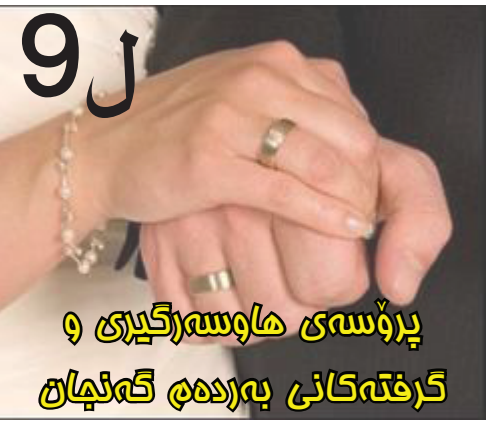
پروۆسەى هاوسەرگێرى و گرتەکانى بەردەم گەنجان