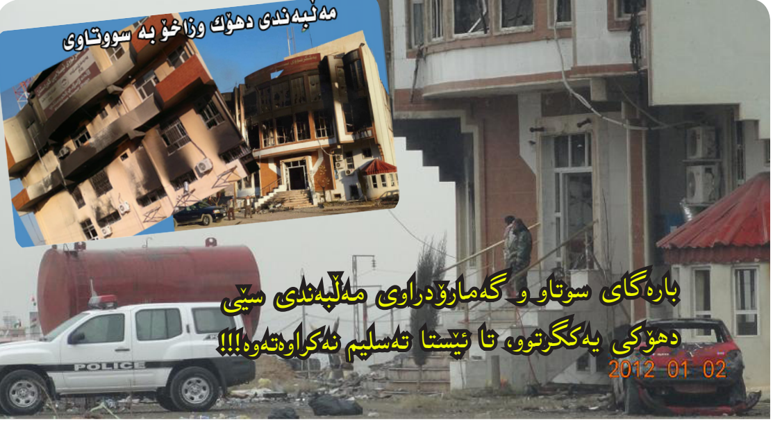
مەلەبەندی دەهۆک و ژاوخۆ بێ سوتتاوی