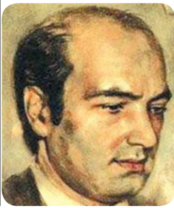
لە وتەکانى دکتۆر عەلى شەرەبەتیدا حەیفە ئەو نیگایەى کە بەس بۆ دیدارە پڕ شکۆ و پڕ رێزەکان بەدى هاتوو، بئى هۆ بەهەدر بەدرییت...» ل 8