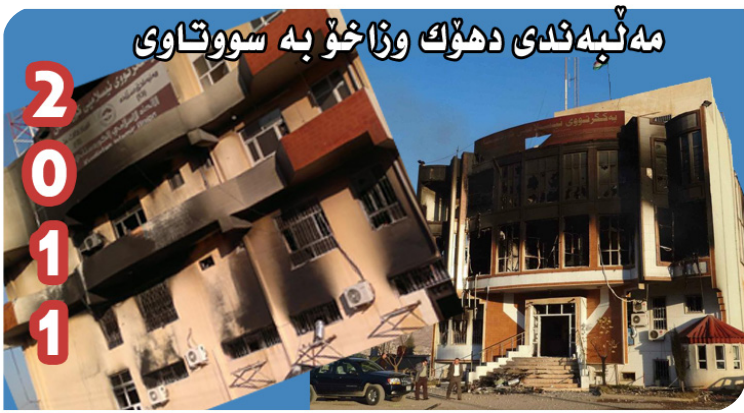
مەنبەئىدى دەھك وڭاخۇ بە سووتايوى

يەكگرتو ۱۷ سال لەمەوپېش وتى: نەبونى مەكتەب غەسكەرى، سېرى قەوتمانە! ئەمپوئىش ئىمە بە بېپەكىمان بەھېزىن، بە ھېمىنيمان براوھىن، بە ئارامگرتنمان فۇشەويستىن، بە مەدەنى بونمان سەردەگەوين!