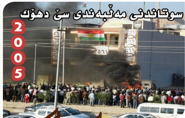
سوتائىدى مەنبەئىدى سىخ دەھك

يەكگرتو ۱۷ سال لەمەوپېش وتى: نەبونى مەكتەب غەسكەرى، سېرى قەوتمانە! ئەمپوئىش ئىمە بە بېپەكىمان بەھېزىن، بە ھېمىنيمان براوھىن، بە ئارامگرتنمان فۇشەويستىن، بە مەدەنى بونمان سەردەگەوين!