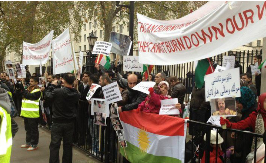
خۆپیشاندانی ره وهندی کورد له بهریتانیا دژی سوتاندنی بارهگاکان