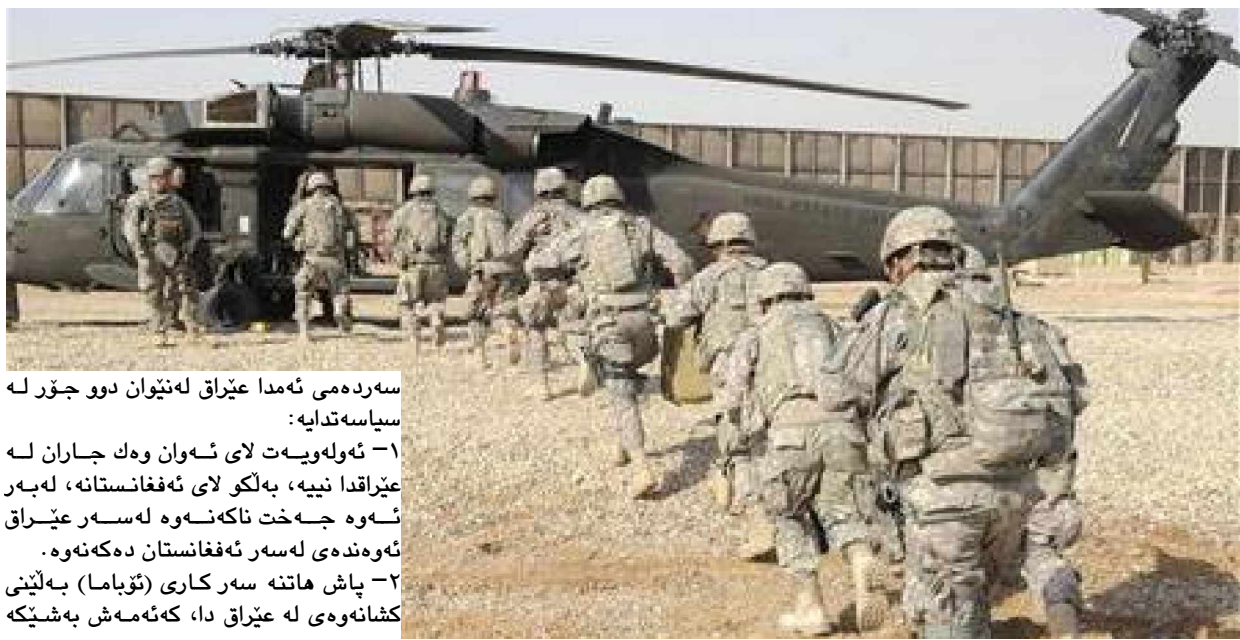
سه رده می ئەمدا عیراق له نیوان دوو جوړ له سیاسی تدا به:

۱- ئەوله ویه ت لای ئەوان وه جارن له عیراقدا نییه، به لکو لای ئەفغانستانه، له بهر ئەوه جهخت ناکه نه وه له سه ر عیراق ئەوه نده ی له سه ر ئەفغانستان ده که نه وه.