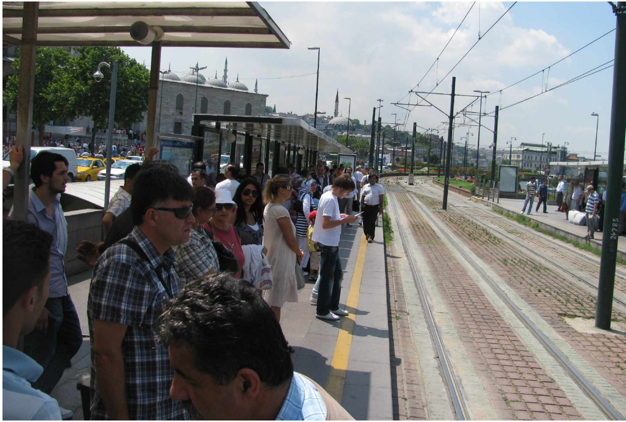
لە ۱۲ ئىل ۋە ئىلۋول، شەقامى تۇركىيا پاكىتى گۇرانكارىيە دەستورىيەكان يەكلايى دەكاتەو

پرسى دەستورى لە ھىچ ۋىلايەتتىكى دۇنيا ھىندە تۇركىيا ھەسەسىيەنى نىيە، ئەو ھى دەستورى تۇركىيا لە دەستورى زۆرىيە ۋىلايەت تى دۇنيا جىادەكاتەو ئەو ھى دەستورى ئەو ۋىلايەت لە دۇيا كودەتايەكى سەربازى لەلەين بەرپرسە گەورەكانى سوپاھ نووسراوئەو ۋە لەلەين زۆرىك لە دامەزراو سىكۇلارەكانى ئەو ۋىلايەت بە موقەدەس ۋە پارىزەرى سىكۇلارىزم لە ۋىلايەت دادەنرەت. لەپىشدا ئەوان ھىچ ترسىكىيان نەبوو لەو ھى كە پارتىكى ئىسلامى ياخود دژە ئايدۇلازىيە ئەوان لە ھەلبۇزاردەكانى دەنگى زۆرىيە بەھىنەت ۋە ۋىلايەت بەرپرسە، چۈنكە ھەركاتىك ھەستىيان بە مەترسى ئەو لەلەينانە بىردايە ئەو راستەوخۇ دەسەلاتەكانى خۇيان بەكاردەھىنا بۇ پەكخستى ئەو ھۆكۈمەتە ۋە بەناشكرا ۋە بە رۇژى رووناك كودەتاي سىپان بەسەر ئەو ھۆكۈمەتە ئەنجام دەدا ۋە سەركردەكانى ئەو پارتانەشىيان لە كارى سىياسى دەخست.