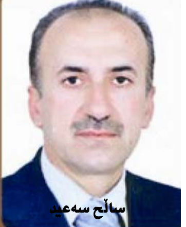
سالح سه عد