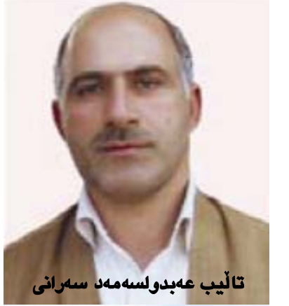
تالیپ عهبدولسه مه د سه رانی

پرژه مان ناماده یه بۆ چه سپانده ی عه داله تی کومه لایه تی و سیاسی و قه ره بو کردنه وه ی زینالیکه وه توانی کوردستان. به خو ریکردنی