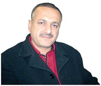
که مال ره نوف...