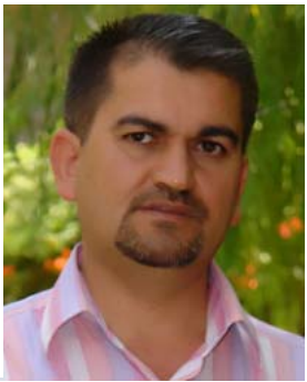
عومر عه لی...